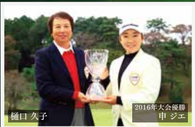
2016年大会優勝 樋口 久子